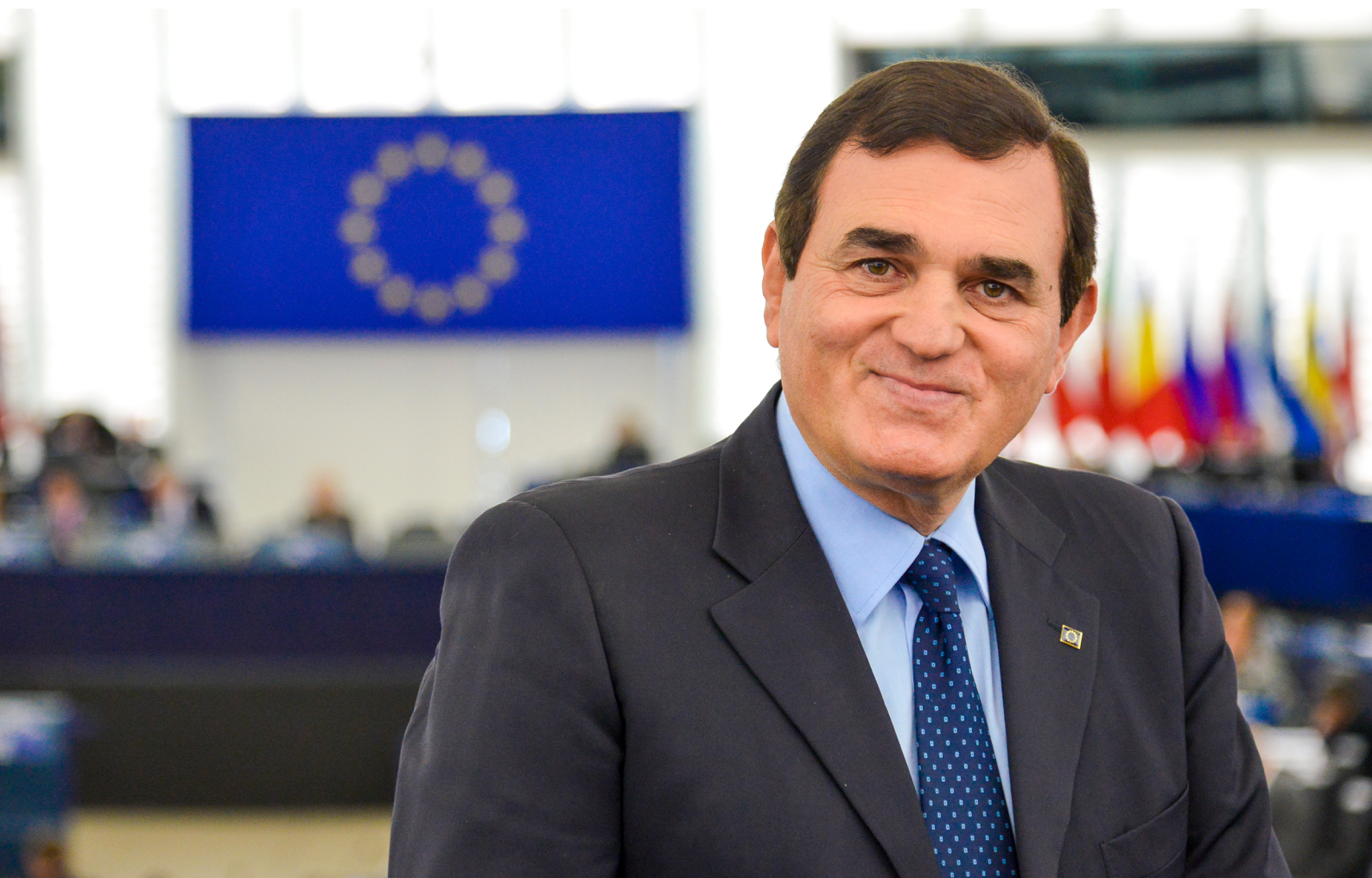
On. Aldo PATRICIELLO • Deputato al Parlamento Europeo • Commissioni ITRE – ENVI